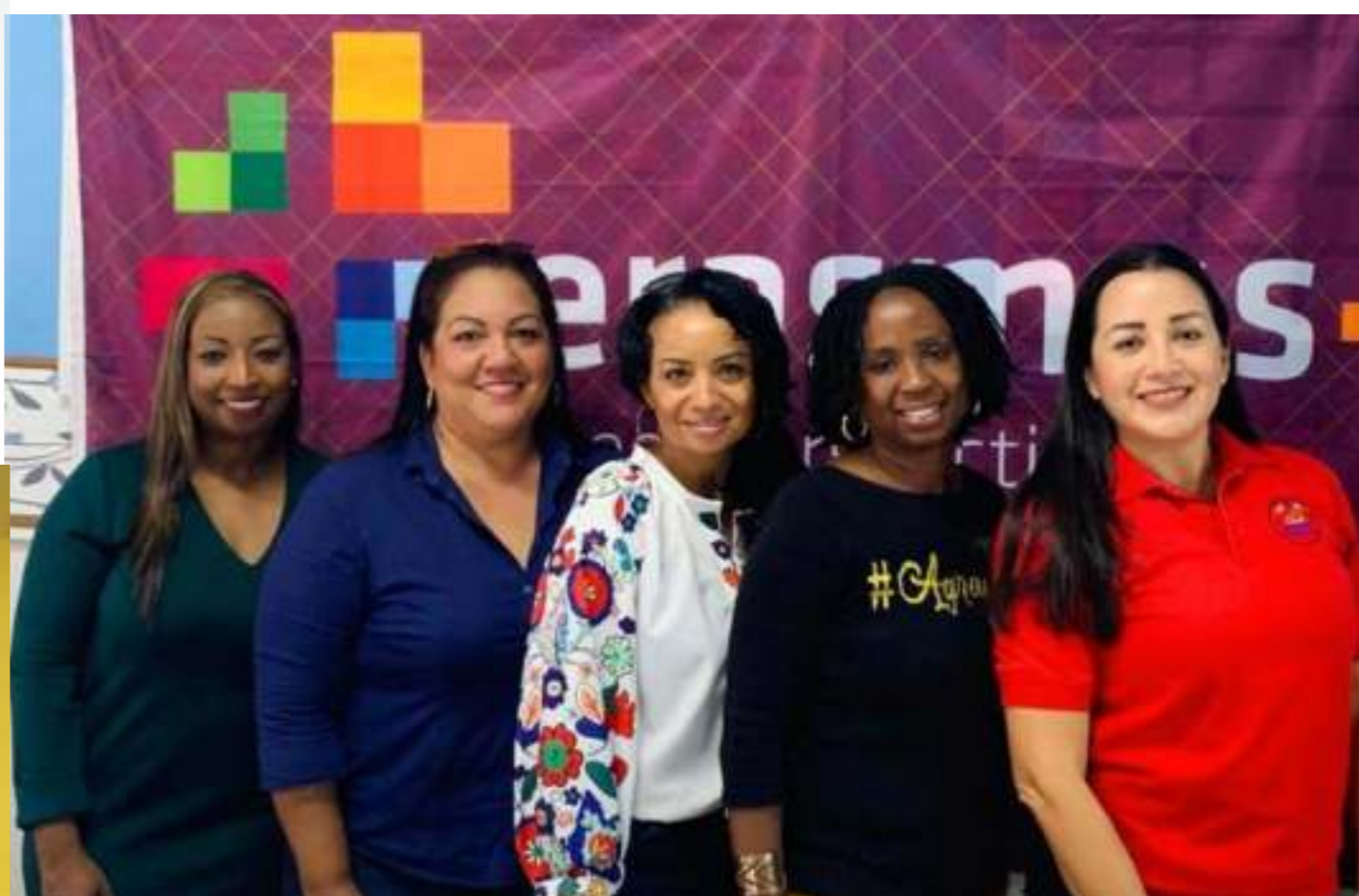
Vertegenwoordigers van de drie basisscholen op Aruba die de komende jaren een bijdrage ontvangen van Erasmus+.