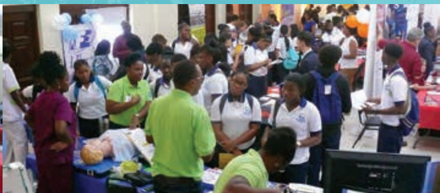
Groepsfoto van de SCS vierde en vijfdejaars leerlingen en docenten.