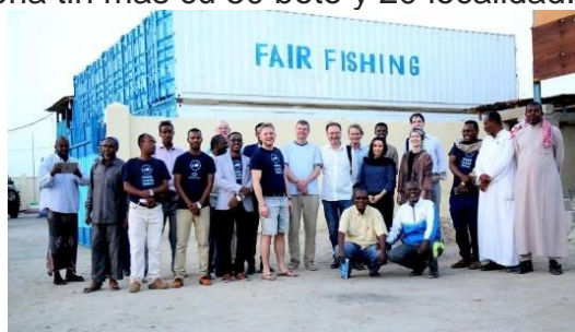
Ilustracion 6. CEO di Fair Fishing hunto cu algun negociante y funcionario di gobierno.

3. Fair Fishing ta opera na dos region semi autonomo di Somalia: Somaliland y Puntland. Na opinion di Bindslev, Fair Fishing mester desaroya actividad riba tres diferente tereno. E promete ta bendemento di ijs cu e piscadonan, pa asina nan por mantene nan piscanan fresco. Ta importante pa bende pisca fresco, pasobra por haya un miho prijs p’e. Antes e prijs di pisca tabata 50 cen pa kilo pa nan por deshaci di e piscanan mas lihe posibel. Awo cu por mantene e piscanan fresco, e prijs di pisca ta subi di 50 cen pa 2 dollar unabes e yega tera. Ora e pisca yega mercado di pisca, e prijs ta bira entre 4 y 6 dollar. Ademas ta provee pa ekipo, pa asina e piscadonan tin suficiente material pa contene e piscanan fresco, y tambe ta introduci programa educativo pa eleva e calidad di loke e chefnan local ta prepara. Awendia e compania ta traha cu mas di 25 negoshi di pesca, di cual mayoria tin mas cu 50 boto y 20 localidad.