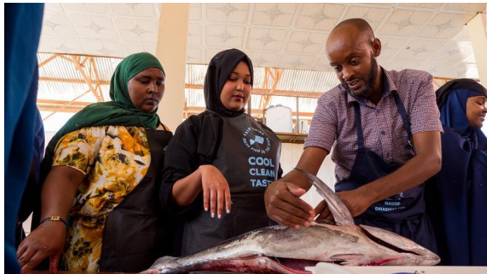
Ilustracion 7: Un instructor ta siña e trahadonan con ta traha cu pisca

7. Pa aña 2021, Fair Fishing ta spera cu e piscadonan di Somalia, e cokinan y tur negoshi relaciona cu pesca lo a yega na 10 miyon dollar di ganashi. “Mi vision ta pa crea paz y negoshi relaciona cu pisca,” Bindslev a declara. “Asina nos ta demostra mundo cu nos por logra hopi cos bon na e luganan hopi vulnerabel”.