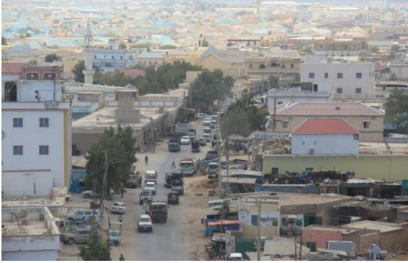
Ilustracion 5: Un bista riba e ciudad di piscado Puntland.

11. Banda di tin cu tin beneficio pa e pueblo mes, instancia externo tambe ta mira beneficio propio. E companianan di seguro a aumenta nan tarifa di seguro di barco cu ta pasa banda di e costa di Africa. Si resulta cu e tripulacion sali ileso y e barco no haya daño considerabel, nan ganashi ta mucho mas. Segun Stella Dubois, economista na Dubai, e situacion ta mas complica di loke hende ta imagina. “E negoshi aki ta asina lucrativo, cu e ta parti di stockmarket . E paisnan Dubai y Saudi Arabia, entre otro, tin parti den e negoshi aki. Claro, si e