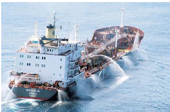
Ilustracion 4: Ta uza e metodo di spuit awa pa evita cu pirata ta subi.

barco, entre otro crucero y barco di pesca, a cuminsa scoge otro ruta cu no ta via Suez Channel , impidiendo asina negoshi cu e paisnan den becindario, Esaki a conduci na un perdida estima di 624 miyon dollar anual. Segun Sky News, 50% di e containernan na mundo ta pasa via e Horn of Africa .