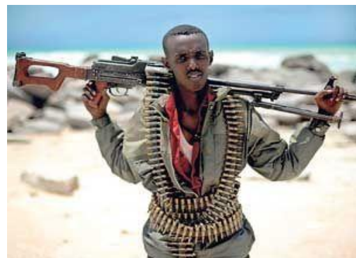
Ilustracion 1: Samakaab Hanad di Somalia

jong. Den un comunicado oficial di gobierno di Somalia, publica na aña 2010, 80% di e piratanan a nace den zona di conflicto parti zuid di Somalia, mientras cu 20% ta descende di e parti noord. Por dividi e piratanan den un herarkia di tres nivel: piscado local, considera e cerebro tras di e operacionnan debi na nan conoce-mento y habilidad riba lama. Na di dos nivel tin e ex militarnan, localmente yama soldad den e herarkia aki, cu a yega di bringa den guerra civil y nan ta fungi como e ehecutornan di e secuestronan. Y no di menos peso ta e expertonan tecnico, cu ta opera e ekiponan manera GPS. Pa e operacionnan aki, e piratanan ta importa arma mas tanto di Yemen. Na Somalia, ta uza e terminologia burcad badeed, cu ta nifica ladron di ocean, pa referi na e piratanan. Aunke, e piratanan aki ta pre-fera yama nan mes badaadint badah, cu ta nifica salvador di e lama.