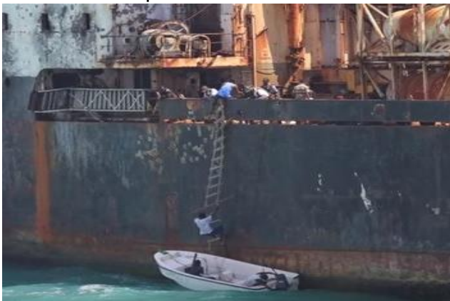
Ilustracion 2: Bista di con e piratanan ta subi tankero.

5. Sinembargo, e piscadonan humilde cu kier a frena e practicanan aki, tabata arma nan mes den grupo y den barco chikito nan tabata ataca e barconan di carga. Pa medio di trapi di cabuya e piratanan ta subi e barconan, exigiendo pago contra libertad di e tripulacion.