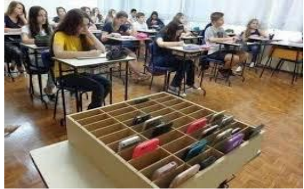
Ilustracion 8: Un solucion pa celular den klas.

5. Contrario cu Merca, Aruba no conoce ningun regla cu ta restringi uzo di telefon celular na scol. P’esey, un parlamentario den oposicion recientemente a entrega un amienda pa introduci regulacion di uzo di celular na tur scol na Aruba. E amienda aki ta encera, entre otro, cu e alumno no mag di tin e aparato cendi na ningun momento na scol. Den caso cu e alumno mester di e celular despues di ora di scol, e mag di tin e paga, den su tas durante les. Na ningun momento e aparato aki mag di sali di tas. Pa sostene su proposicion, e parlamentario aki ta argumenta cu e maestronan ta keha cu nan ta haya hopi problema ora di les y tambe problema ora cu alumno horta of kibra celular di otro.