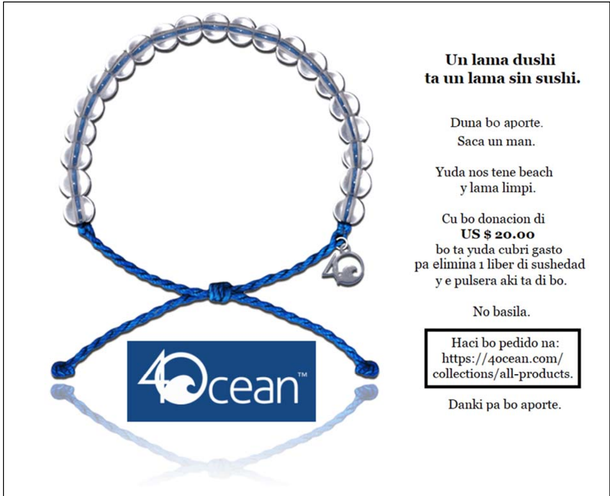
Ilustracion 3: Campaña di 4Ocean

piscado mes no a pone atencion na dje ta cu despues di traha 8, 10, 12, 14 ora, nan ta yega cas cu algun pisca chikito, mientras tur e plastic cu a pega den nan redanan, nan tabata tira bek den lama. Pa nan y nan ubicacion geografico e ta dies biaha mas facil pa subi lama y colecta plastic, cu gara pisca." Asina un vocero di 4Ocean pa region di Caribe, dr. Angelina Slater, a splica. Entre tanto, el a tuma practicamente dos aña di campaña informativo, prome cu e piscadonan a cuminsa mira y kere den e proyecto.