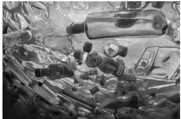
Ilustracion 1: Sushedad plastic den lama

7. Mester tin un manera pa colecta sushedad plastic for di den lama. E pensamiento a bira un proyecto escolar simpel cu despues a desaroya den henter un investigacion teoretico na Universidad Tecnologico di Leiden. Un posibel solucion sin posibilidad di bida, Slat a pensa, pa despues e bisa: “E tecnologia no ta existi, no tin e capacidad laboral suficiente pa realisa e proyecto, no tin e espacio pa e hendenan haci trabou preparatorio y pa culmina, no tin e placa pa facie tampoco.” Su presentacion na TEDx Delft a haci e problema mundial di sushedad marino bira conoci pa mundo henter. Ey a nace e posibilidad pa realisa e proyecto Great Pacific Garbage Patch cu lo haci e Oceano Pacifico limpi den 5 año aproximadamente.