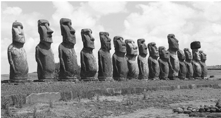
Ilustracion 5: Careda di estatua na Rapa Nui

6. Algo cu caracter sorpresivo mester a pasa na Rapa Nui. No ta tur e estatuanan ta completamente acaba, cual ta sugeri cu e practica tabata bibo y produciendo, net prome cu a bandona nan di modo repentino y misterioso. Algun arkeologo y historiado a coba y realisa estudio empirico riba diferente sitio pa haya mas informacion di bida riba e isla. Consecuentemente, e cientifico Carl Lipo, antropologo principal di Universidad di Binghamton, a conclui cu algun estatua no a alcanza nan ubicacion final, nan a keda riba estructura di palo manera flota, probablemente bayendo nan locacion definitivo, cual ta un di e descubrimentonan tecnico di escavacion arkeologico cu mas tanto a hala atencion.