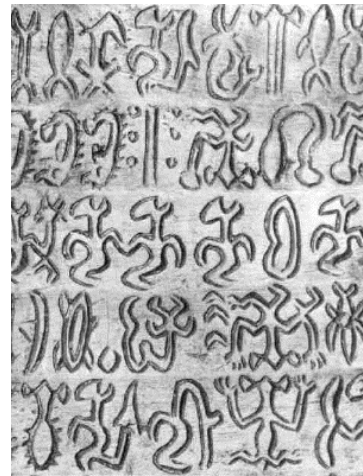
Ilustracion 6: Tabla di escritura antiguo

13. Den siglo XIX e konkistadonan a descubri un sistema di escritura riba e Isla di Pasco cu nan a yama rongorongo . E forma grafico, primordialmente coba cu un obheto di punta obsidiano, den mayoria caso tabata taya of marca den tabla di palo duro. Den e epoca aya e habitantenan tabata uza e piedra skerpi aki, conoci como e glas volcanico, pa crea punta di flecha y probablemente tambe como parti di herment pa corta y coba. Esaki debi cu por veilo e piedra ceramico di tal modo cu e ta bira hopi skerpi.