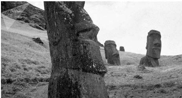
Ilustracion 4: Estatua moai riba Rapa Nui

2. Tabata den año 1722, cu e explorado Hulandes Jacob Roggeveen a aterisa riba un isla chikito den Ocean Pacifico. Segun kalender Catolico di e