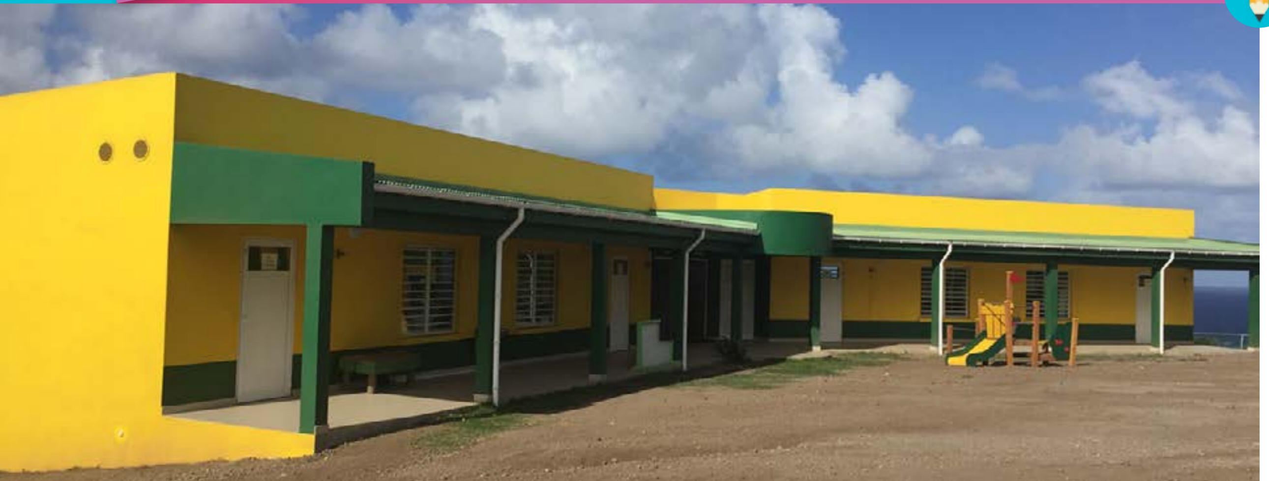
Nieuwbouw Seventh Day Adventist School (SDA School)