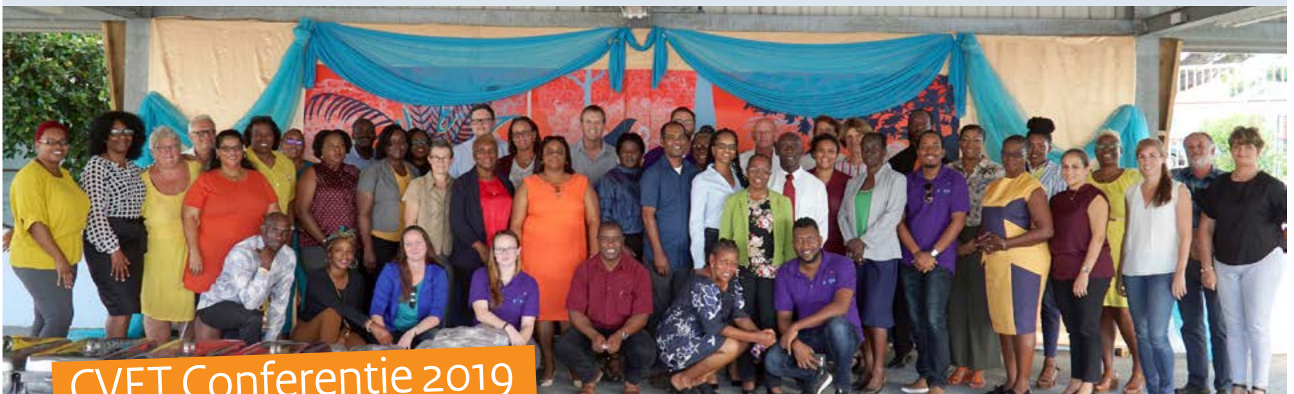
CVET Conferentie 2019

1 CVQ staat voor Caribbean Vocational Qualification. CVQ is de beroepsonderwijs component van het onderwijs- en examensysteem van de CXC (Caribbean Examination Council). www.cxc.org