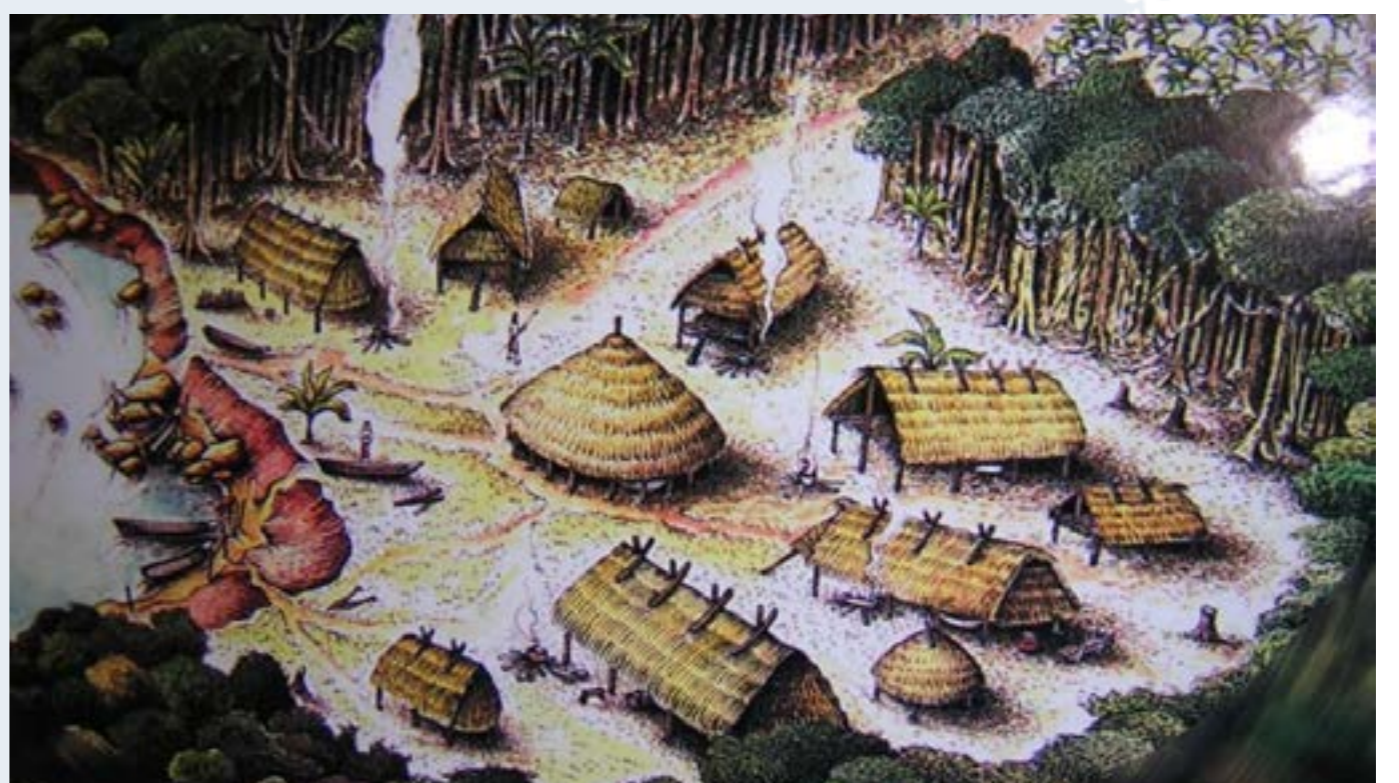
Reconstructie van dit type indianendorp

“HET IS EEN VOORRECHT VOOR DE SGB OM EEN SCHOOL TE BOUWEN OP DE FUNDAMENTEN VAN EEN DORPJE UIT DE 12 DE EEUW. DE TIJD ZET ZICH VOORT. ONTWIKKELINGEN STAAN NIET STIL. MAAR MET RESPECT VOOR DE BESCHAVING WAAR HET ONDERWIJS OP BONAIRE OP VOORTBOUWT.”