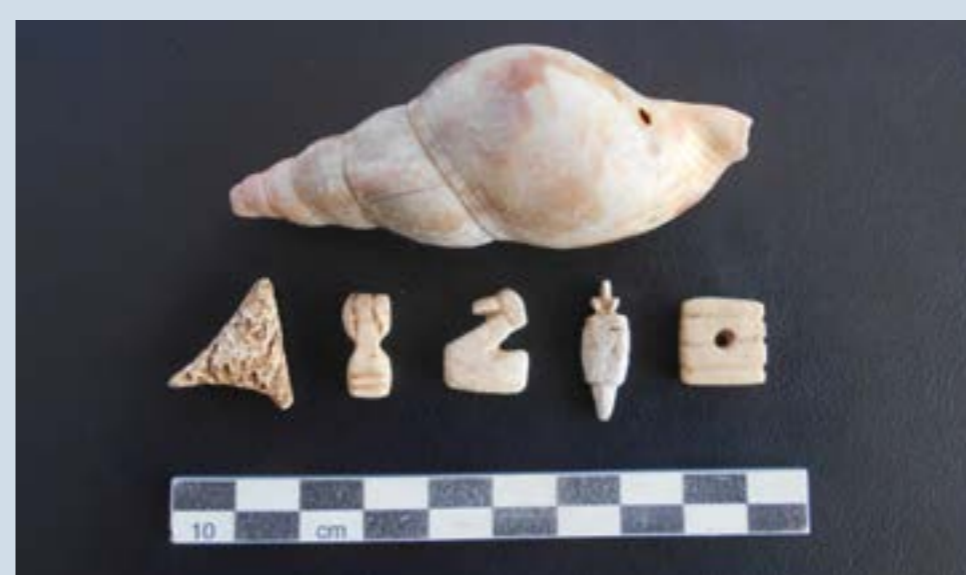
Een deel van de gevonden schelpen amuletten

Uit onderzoek naar de gevonden artefacten blijkt, dat zich rond het jaar 900 na Christus op die plek een pre-Columbiaanse nederzetting moet hebben bevonden van de Caquetio indianen .