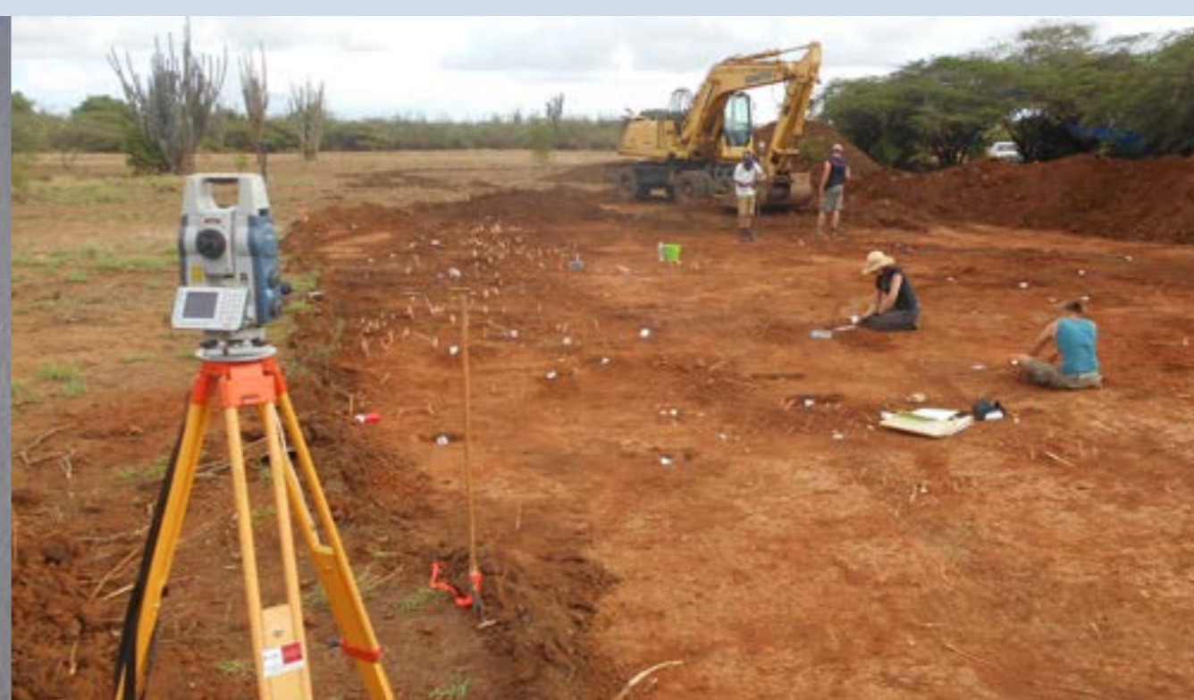
Archeologen aan het werk