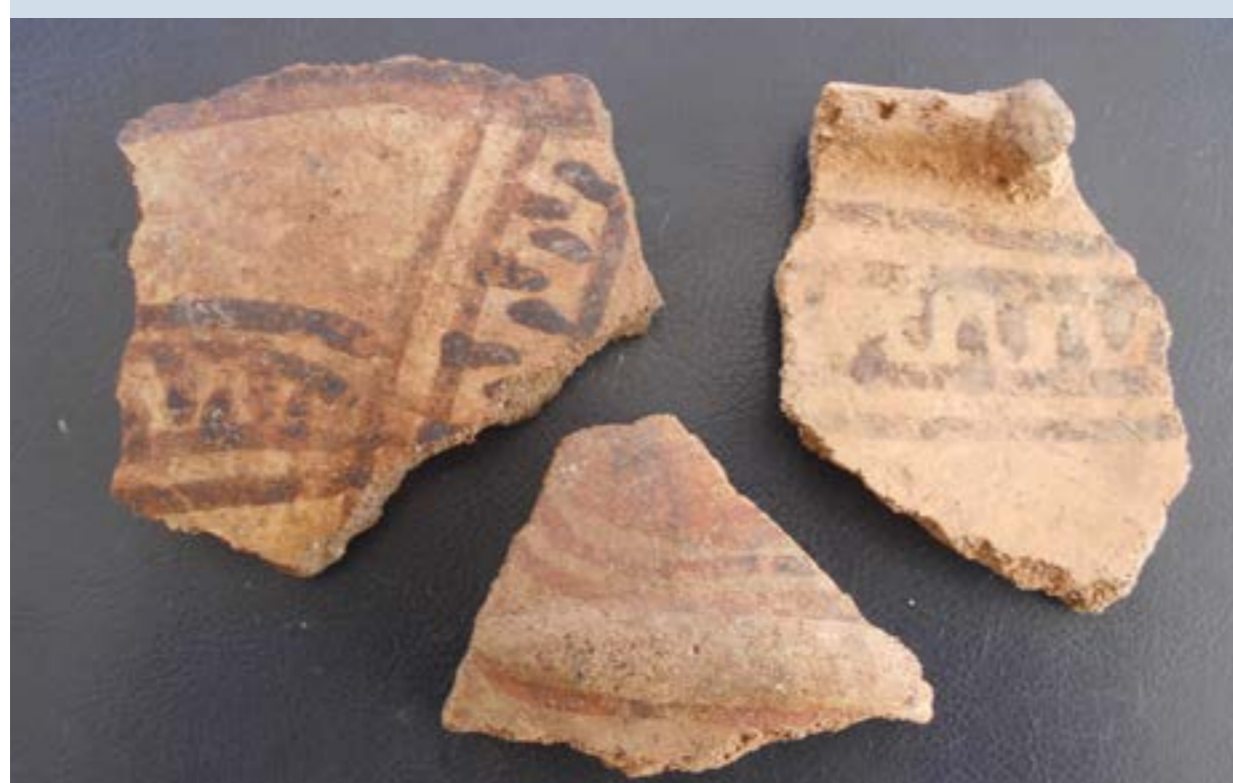
Gevonden keramieke artefacten