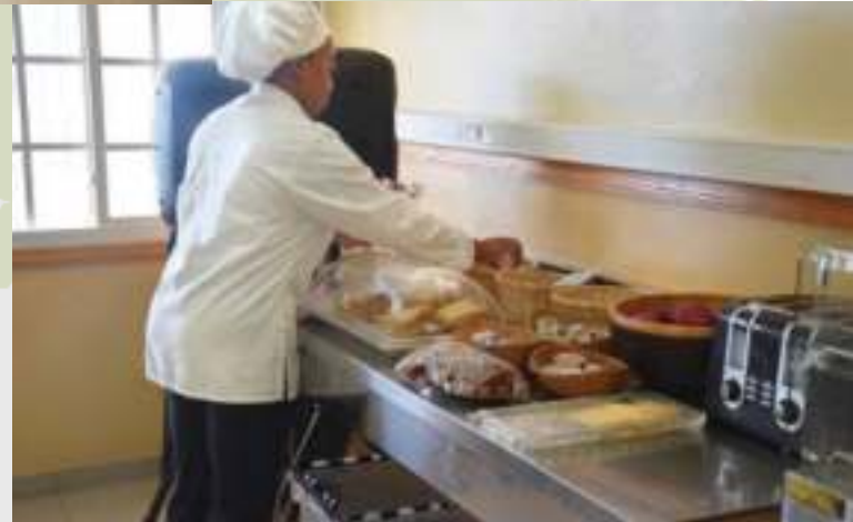
Het schoolontbijt is beschikbaar voor alle leerlingen