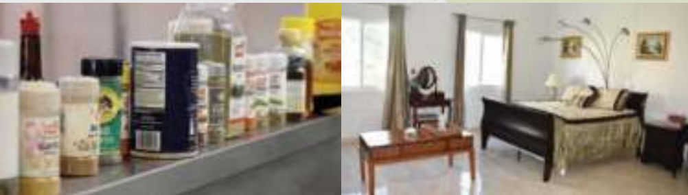
De Bed & Breakfast van de school

“DE GASTEN VAN DE BED & BREAKFAST ZIJN ONDER DE INDRUK VAN DE GOED UITGERUSTE KAMER.”