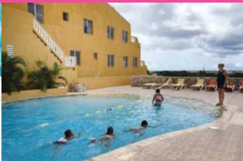
Zwemles op Bonaire

Al sinds november 2016 organiseren de Sint Eustatius Sports Facility Foundation (SSFF) en de Sint Eustatius Swimming Association (SESA) zwemlessen voor leerlingen van de groepen 3. Na de orkaanperiode in september 2017 wordt er een inhaalslag gemaakt. De leerlingen van groep 4 en 8 krijgen nu ook les, zodat in 2018 alle kinderen die de basisschool afronden, hun zwemdiploma A hebben. Veiligheid en kwaliteit staan in dit project voorop.