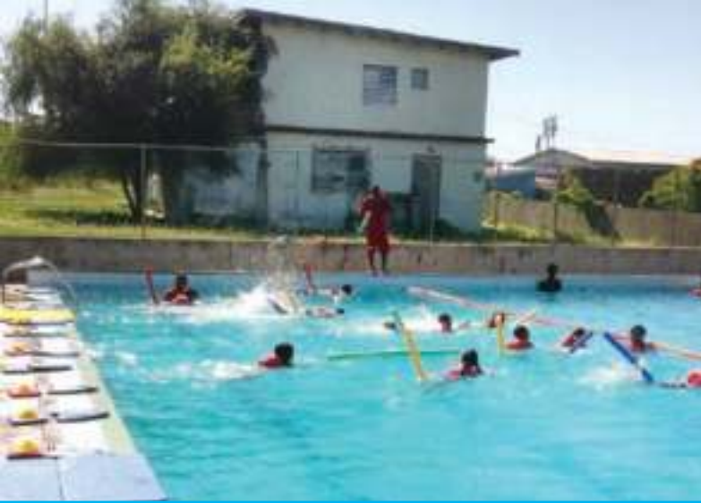
Zwemles op Sint Eustatius

‘HET LIJKT WEL OF WIJ DE KINDEREN ELKE WEEK EEN NIEUW CADEAUTJE GEVEN, ZO VROLIJK ZIJN ZE WANNEER ZE HIER ARRIVEREN.’