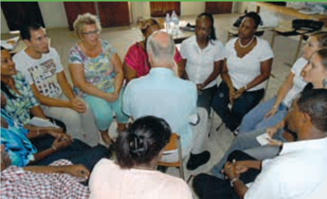
Docententaining bij de Bethel Methodist School.