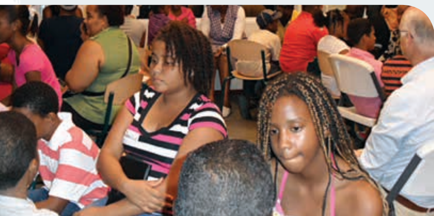
Ouderavond bij de Governor de Graaff School.

DE DOCENTEN VAN DE BETHEL METHODIST SCHOOL ZITTEN IN EEN KRING. ÉÉN VAN HEN HEEFT EEN ZWARTE PET MET EEN ADELAAR EROP GETEKEND: ZIJ IS DE ZOGENAAMDE "BULLY". ZIJ PLAAGT EN JENT HAAR COLLEGA, DIE EEN GELE PET OP HEEFT MET EEN KONIJNTJE EROP. EEN ANDERE COLLEGA, MET EEN RODE PET MET EEN AAPJE EROP, HEEFT DE GROOTSTE LOL. ZIJ ONDERSTEUNT MET DIT GEDRAG DE BULLY. DE DOCENT MET DE GELE PET VOELT ZICH STEEDS STERKER IN HET NAUW GEDREVEN EN KIJKT HULPELOOS NAAR DE REST VAN DE GROEP: WIE HELPT HAAR OM ZICH TEGEN DE AANVALLEN VAN DE BULLY TE VERDEDIGEN?