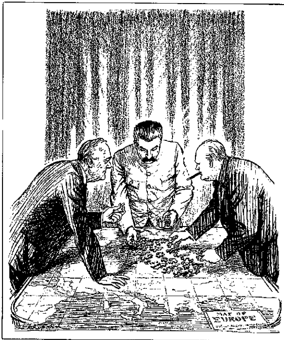
TROUBLE WITH SOME OF THE PIECES

Bron 10: Problemen met sommige van de puzzelstukjes , een cartoon uit Punch over de conferentie van Jalta