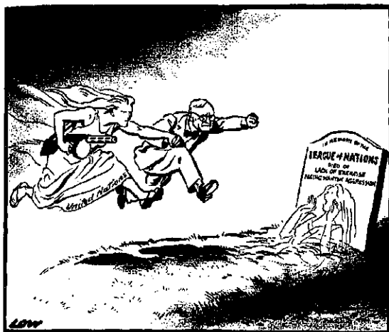
HISTORY DOESN'T REPEAT ITSELF

Bron 11: De geschiedenis herhaalt zich niet , een cartoon gemaakt door David Low.