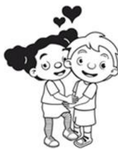
Dun'e un brasa