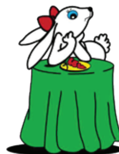
elleboog riba mesa