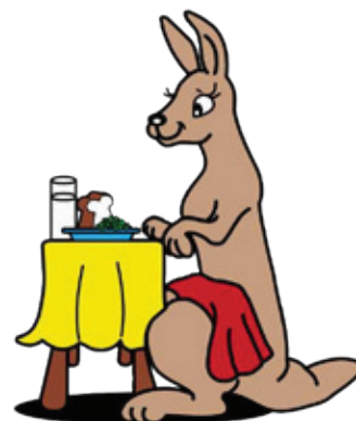
serbete den scochi