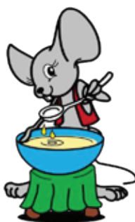
uza cuchara pa come sopi