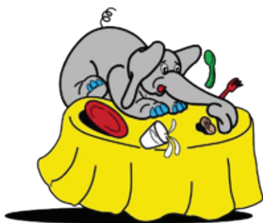
cruza mesa pa coy algo