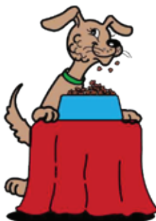
come boca cera