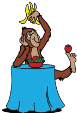
hunga na mesa

Mira e plachinan y marca un ronchi rond di e esnan cu tin bon manera na mesa. Dicon bo ta haya cu e otronan no tin bon manera?