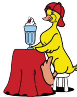
pechi riba cabes