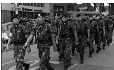
peloton di soldaat